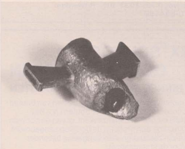
Daarna de hulpventuri . . .